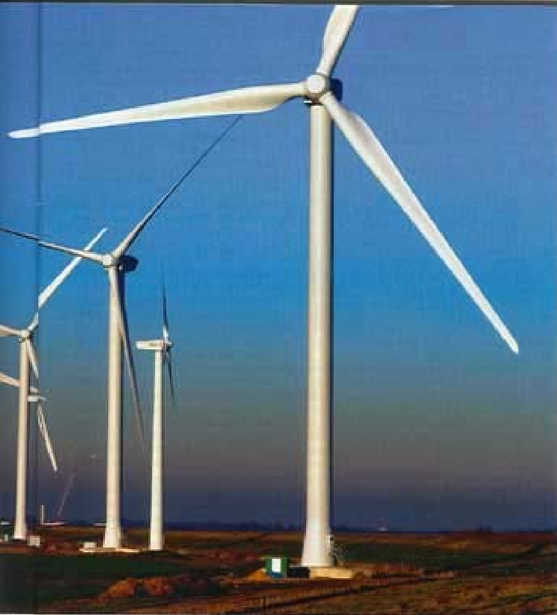
gegen die zunehmende Verspargelung der Landschaft

► Die Kosten, die Verbraucher für den Ökostrom bezahlen müssen, liegen deutlich höher als bisher angenommen. Nur für die von der Bundesregierung geplante Steigerung der Windstrommenge von 2003 bis 2015, heißt es in der Studie, summieren sich die „Netto-Zusatzkosten“ auf 12 bis 17 Milliarden Euro. Die Investitionen für das Netz und die Förderung des Altbestandes sind darin nicht einmal enthalten.