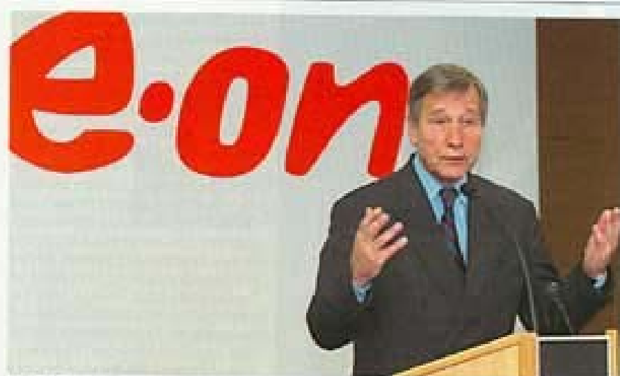
Wirtschaftsminister Clement bei E.ON-Veranstaltung: Im Clinch mit dem Kollegen Trittin

gebieten wieder kritische Situationen eintreten. Wenig schmeichelt sind auch die Aussagen zu einem immer wieder als Hauptgrund für die Förderung der Windenergie genannten Argument: der Verringerung des Treibhausgases CO 2 .