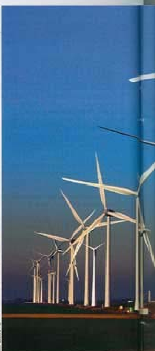
Windpark in Schleswig-Holstein: Widerstand

► Die durch Windenergie eingesparte Menge des klimaschädigenden Gases CO 2 könnte mit anderen Maßnahmen billiger erreicht werden.