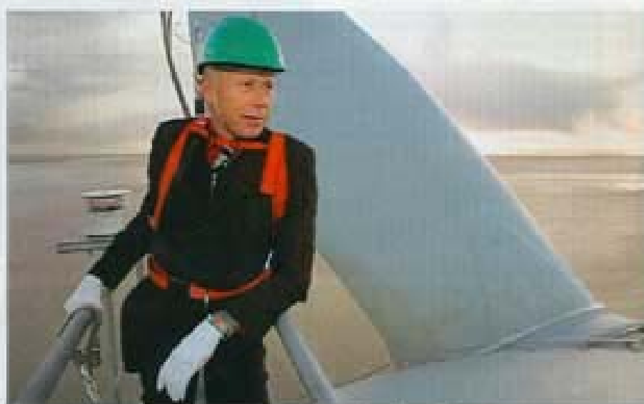
Umweltminister Trittin auf einer Windradgondel: „Vertreterbare Kosten“

Die Ergebnisse einer von der Bundesregierung in Auftrag gegebenen Studie über den Ausbau der Windkraft sorgen für gewaltigen Wirbel: Der von Rot-Grün propagierte Ökostrom wird für die Verbraucher wohl deutlich teurer als bisher vermutet.